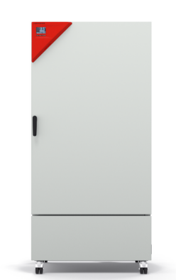
型号 KB ECO 400