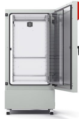
型号 KB ECO 400